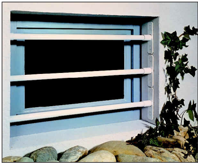
Modell SECURIX® Universal

Komplettgitter 110cm Bestellnummer für Ausführung - weiß: 304105W - schwarz: 304105S