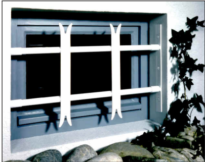
Modell SECURIX® Classic

Darüber hinaus sind Einzelstreben 110cm bzw. 150cm lang sowie Einfach- und Doppel- seitenteile in weiß, schwarz und feuer- verzinkt lieferbar.