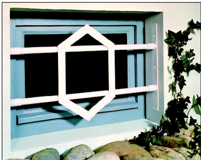
Modell SECURIX® 2000