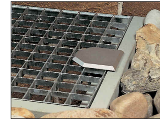
Ansicht von oben, beide Typen